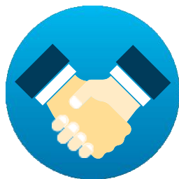
Национален или местен ползвател, който е клиент/възложител от публичния сектор

Той е насочен към заинтересованите страни от европейския публичен сектор, които разработват политики, свързани със секторите, клиенти от публичния сектор, които възлагат обществени поръчки, притежават или експлоатират изградени активи, като например публична инфраструктура или сгради.