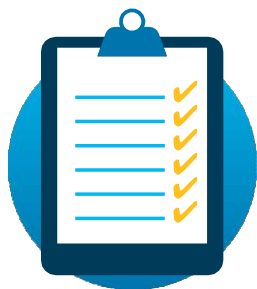
Ползвател от сферата на публичните политики

Настоящият наръчник се основава на колективните знания и опит на участниците в EUBIMTG и на резултатите от европейско проучване на програмите за BIM в публичния сектор и стандартите, които съществуват или са в процес на разработване.